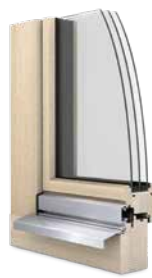
Fenêtres bois Ego®Woodstar

Notre propre département de recherche et développement travaille pour pouvoir innover continuellement. Par conséquent, EgoKiefer répond à tout moment aux exigences du marché. Et ce, aussi bien en termes de portes et fenêtres que d'esthétique ou de fonctionnalité.