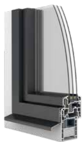
Fenêtres PVC/aluminium Ego®Allround