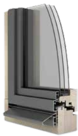
Fenêtres bois/aluminium Ego®Allstar