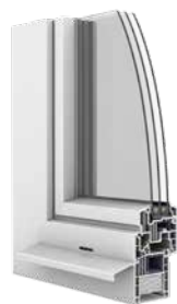
Fenêtre PVC Ego®Allround