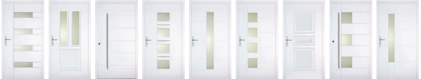
Alliso Amsterdam Antelli Arvamo Balino Berneo Bruxelles Caverro Cia