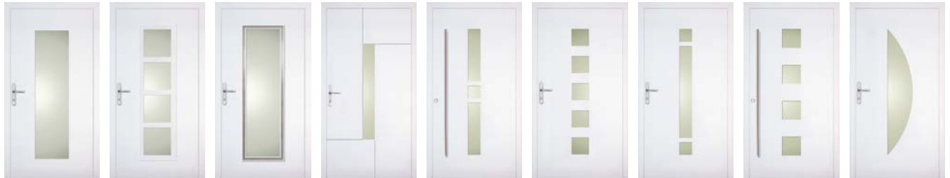
Consis Export Dalmo Delion Desa Ecodora Belido Ecodora Camara Ecodora Delmaro Ecodora Dicoma Ecodora Mirea