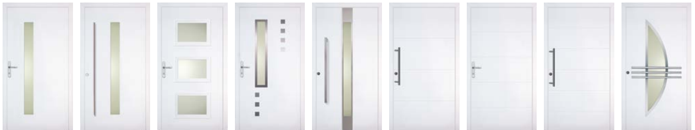
Ecodora Versio 1S Ecodora Versio 2M Emon Index Intelio Liseo W3i Liseo W4i Liseo W5i Luxa