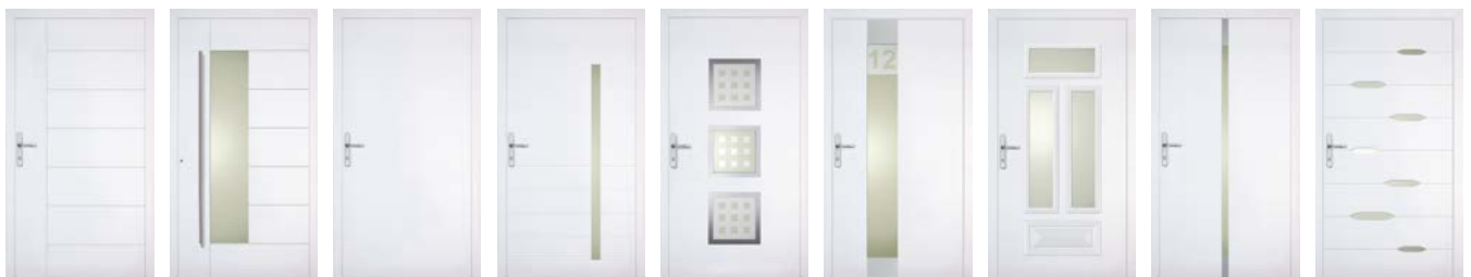
Metris Metris verglast Monolit Myt Neutro Numira Paris Penda Seranta