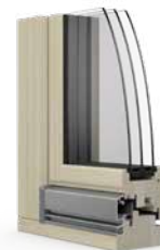
La fenêtre en bois Ego®Selection