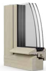
Solutions pour la conservation des bâtiments historiques