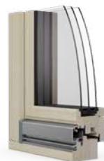
La fenêtre en bois Ego®Allstar