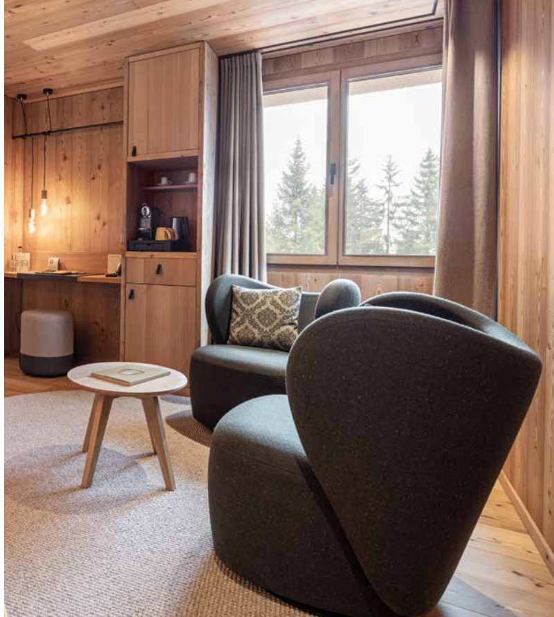
Ego®Allstar: une esthétique naturelle associée aux normes techniques les plus récentes.