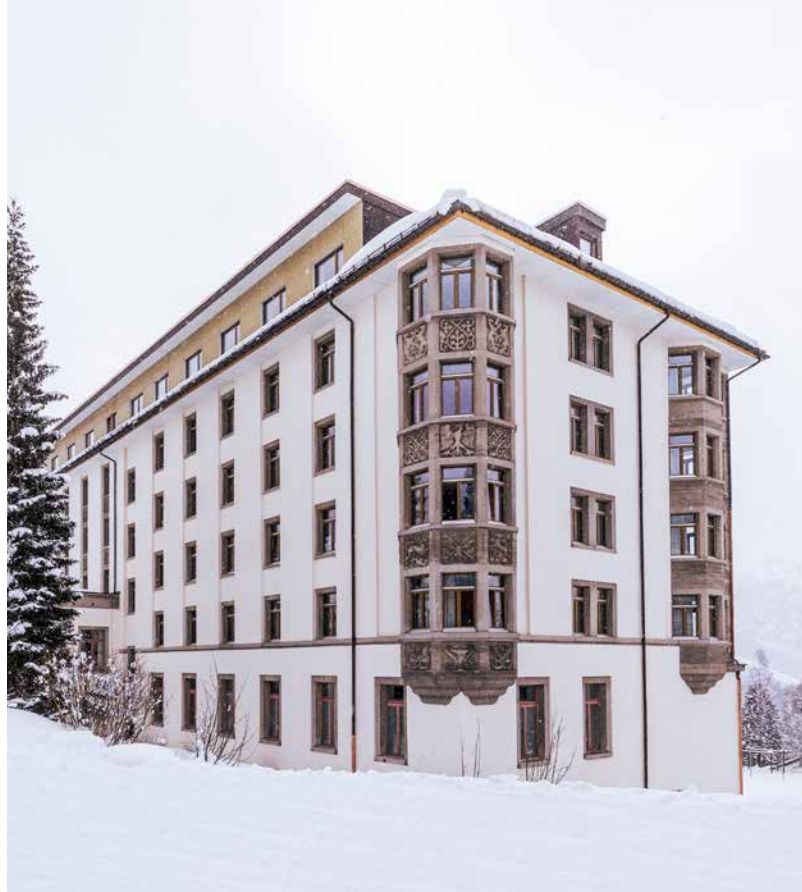
Conservation des bâtiments historiques: la fenêtre en bois allie esthétique classique et confort moderne.