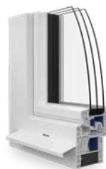
La fenêtre en PVC Ego®Prime