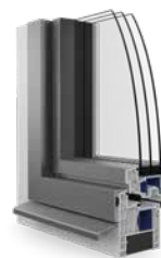
La fenêtre en PVC/aluminium Ego®Prime